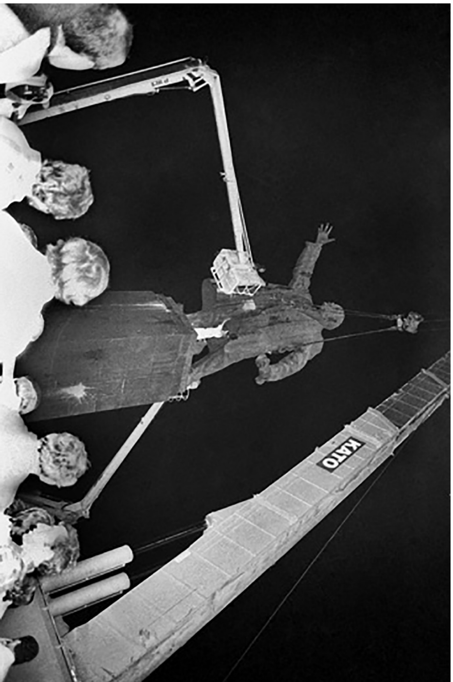
1990 წლის 29 აგვისტოს, დამის 1 საათსა და 20 წუთზე თბილისის ცენტრში აიღეს ლენინის ძეგლი.